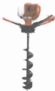
Perfurador de Solo a Gasolina.

→ Que seja adquirido a ferramenta para o Setor de Obras um perfurador de solo para facilitar no dia a dia dos funcionários braçais na execução de trabalhos que envolvem todo tipo de cercamentos.