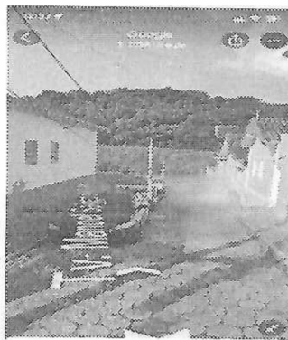
83 Tr. Manoel Salgado

Justificativa: Devido ao movimento intenso na Travessa, os bloquetes estão se soltando danificando os veículos que circulam ali.