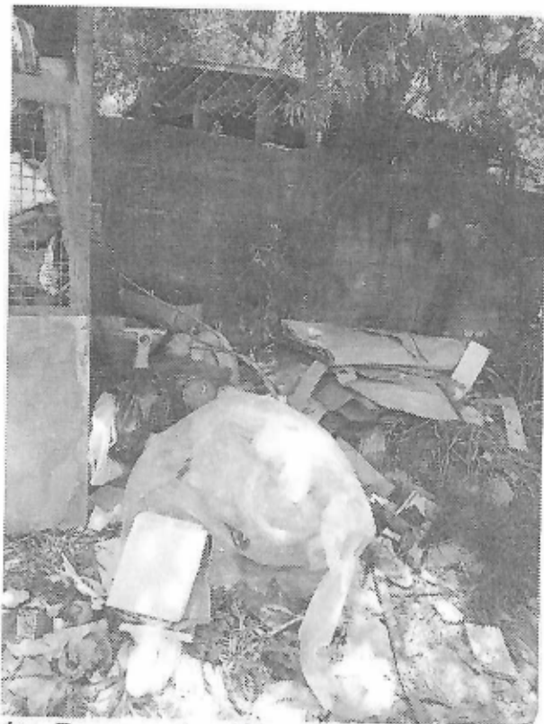
Ver. Proponentes (Bloco Parlamentar Popular)