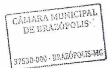
Carlos Alberto Morais Prefeito Municipal de Brazópolis